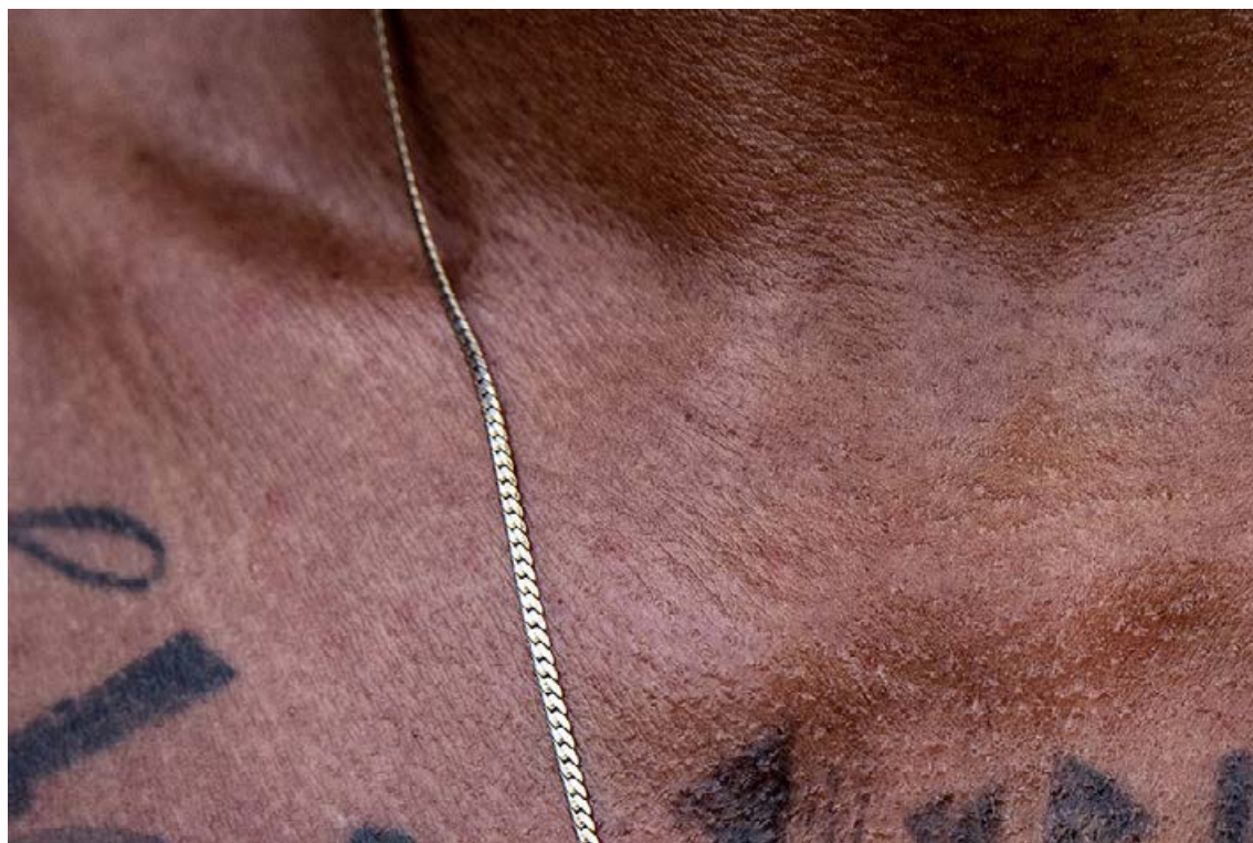
JAIR COLL. COLOMBIA.