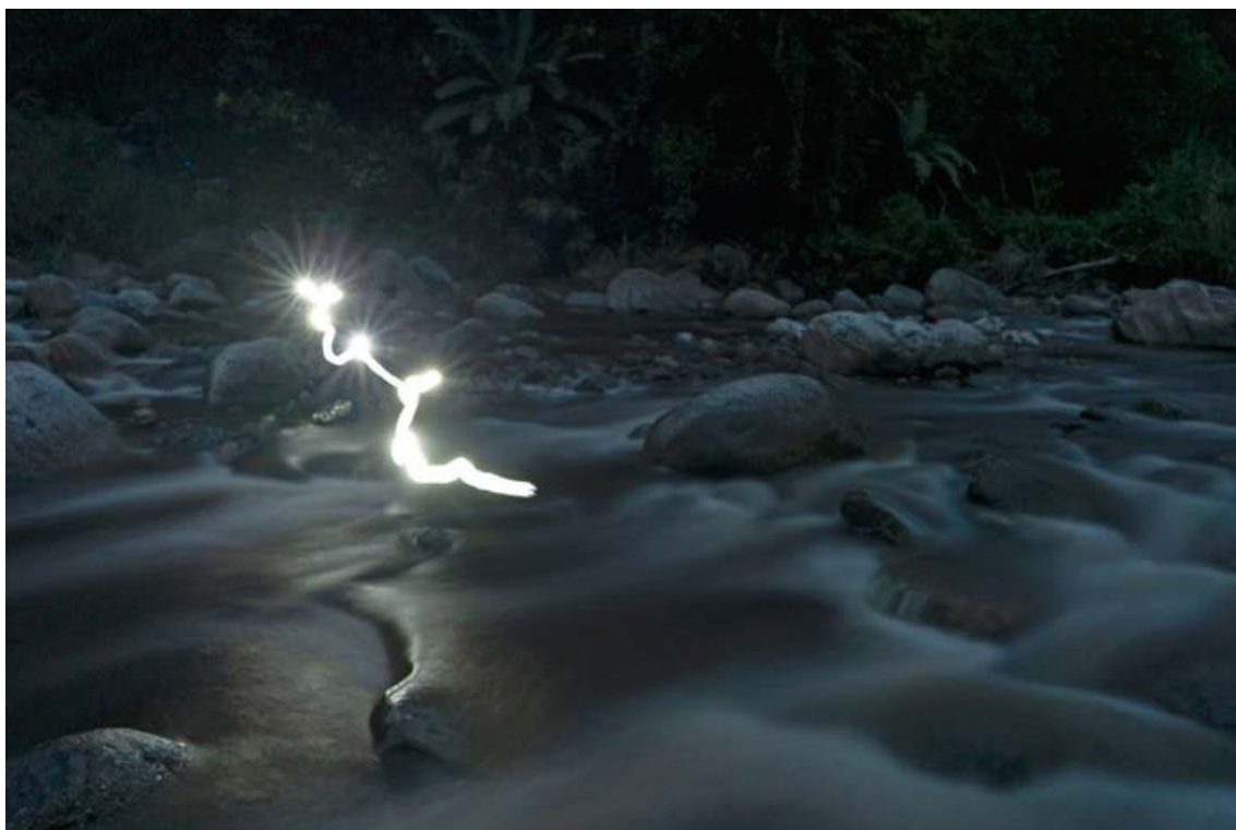
NATALIA ORTIZ. COLOMBIA.