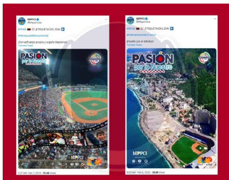
FIGURA 4 SERIE DEL CARIBE

Una semana después de celebrarse la Serie del Caribe en el país, y en plena efervescencia por el éxito del evento deportivo, el Gobierno utilizó inteligencia artificial como parte de su estrategia propagandística para demostrar el progreso económico. Para ello, a través de un reportaje para House of News En español , dos avatares creados con el software Synthesia explicaban los avances de nuestra economía, haciendo mención de la ocupación hotelera para los carnavales y de las ganancias obtenidas por la Serie del Caribe. Estos videos fueron difun-