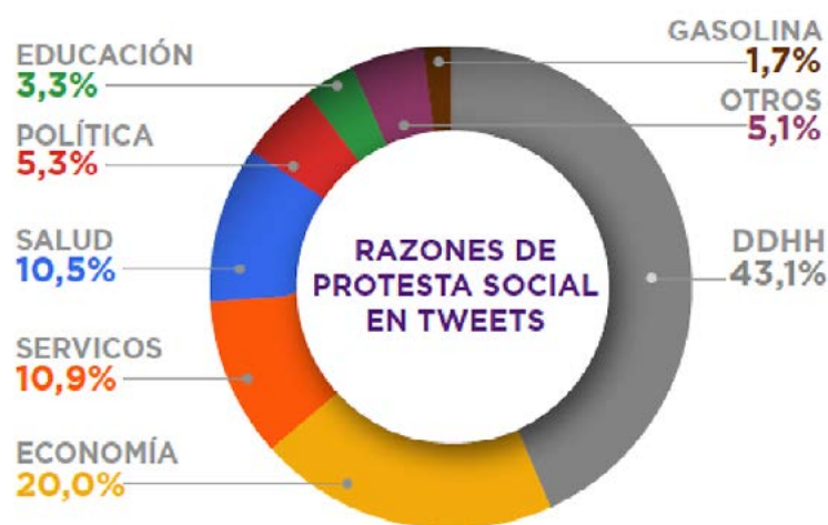
FIGURA 1. RAZONES DE PROTESTA SOCIAL EN TUIITS

ticos. Educación , veinte tendencias (3,3 % de la conversación digital) vinculadas con el sistema educativo en el país. Gasolina , once etiquetas y más de 33 mil mensajes sobre la escasez de combustible. Otros , diecisiete tendencias de protestas y 105 mil 051 tuits vinculados con temas diversos (ver figura 1).