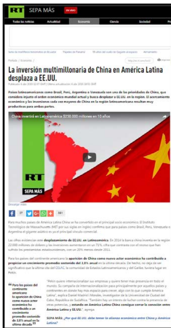
Capturas de pantallas de diferentes medios y fechas

Las relaciones entre China y América Latina se han dinamizado y fortalecido en la última década. Comercio, convenios bilaterales y cooperación en grandes proyectos del sector tecnológico, energético y de infraestructura destacan al momento de caracterizar estos nexos que también tienen un marco de acción en el terreno comunicacional. Así, las principales herramientas de las que se sirve China a la hora de interactuar con el sector mediático latinoamericano son: 1.-Colaboración en la financiación y el lanzamiento de satélites de comunicación, que proporcionan a los países beneficiarios mayor capacitación, al tiempo que amplían la influencia de los medios chinos en América Latina. 2.-Subvención a periodistas latinoamericanos de viajes a China y de asistencias a conferencias mediáticas en el país asiático. 3.-Visitas al subcontinente de altos funcionarios chinos, que buscan promover el apoyo al trabajo conjunto en el ámbito mediático.