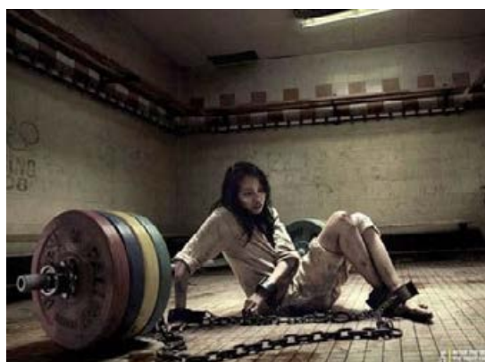
Selección de imágenes de la campaña ‘Pekín 2008: derechos humanos en China ya’ desarrollada por Amnistía internacional durante los Juegos Olímpicos, 2008.

Se cree que este sistema se actualiza a medida que avanza la tecnología, permitiendo a las autoridades chinas ejercer un férreo control de los contenidos de Internet.