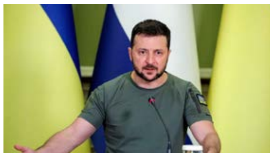
Volodímir Zelenski, 2022

ficación ideológica y visual que las ropas del mandatario generan. 'Hay dos mensajes clarísimos. Uno es contraponer a la figura distante y fría del presidente ruso, Vladímir Putin, con su