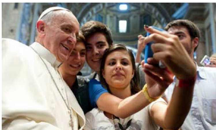
Selfie del Papa Francisco con un grupo de jóvenes en la basilica de San Pedro, 2013