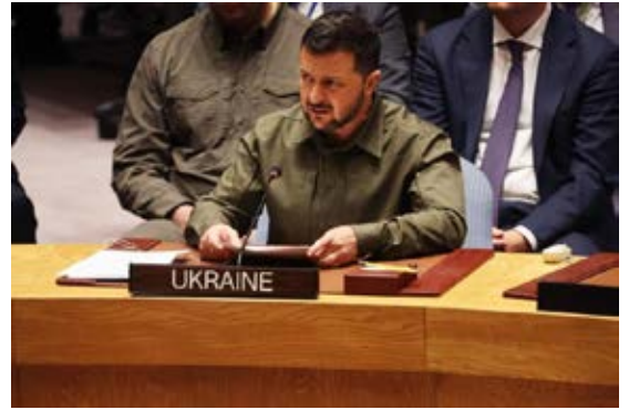
El presidente de Ucrania, Volodimir Zelenski, durante su intervención en el Consejo de Seguridad de la ONU este miércoles. Foto: Spencer Platt / Getty Images /AFP, 2023

Los líderes mundiales, actores por excelencia del poder, asumen este nuevo escenario donde las comunicaciones y la fotografía resultan estratégicas, especialmente cuando hablemos de marketing político o de diplomacia no tradicio-