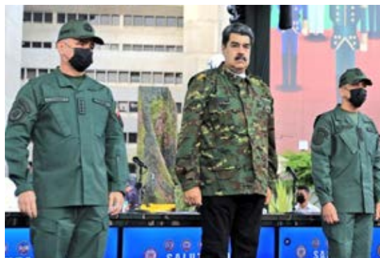
Imagen publicada en el sitio oficial y en redes del PSUV acompañada del título "Ministro Padrino López: Unión cívico-militar cada día más vigente".

Desde el ámbito castrense la fotografía permite poner a la vista autoridad y supremacía. De ahí que el uniforme y las insignias se ponen y se quitan de acuerdo a las circunstancias, e incluso los líderes que no han desarrollado carrera militar imitan sus colores y estilos (parece pero no es). La cámara de nuevo se hace presente para capturar y divulgar. Para explicarlo bastan las fotos que presentamos del presidente Nicolás Maduro.