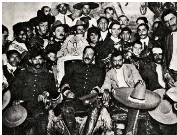
“Villa y Zapata en la silla presidencial”. Foto: Agustín Víctor Casasola, 1917

En otro contexto, tenemos la foto del encuentro de Francisco “Pancho” Villa, Emiliano Zapata con otros revolucionarios en el Palacio Nacional, el 6 de diciembre de 1914. Es una imagen posada que muestra la llegada victoriosa de los revolucionarios a la capital. Villa ocupa la silla que había sido emblema del poder de Porfirio Díaz. Los detalles de esta imagen han sido ampliamente examinados por su carga simbólica, en la que todo parece estar en su justo lugar, sin llegar a ser fría o excesivamente calculada. El mensaje explícito y valor histórico de esta fotografía la han convertido en ícono de la revolución mexicana.