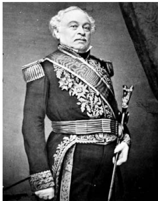
Retrato del general José Antonio Páez.