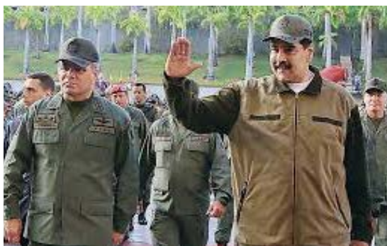
El general Vladimir Padrino López, junto a Nicolás Maduro en Fuerte Tiuna, Caracas.