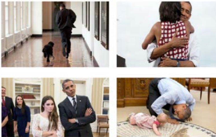
Algunas de las fotografías del expresidente Obama realizadas por Pete Souza.

nal. El caso del expresidente estadounidense Barack Obama es emblemático en este sentido. El mandatario contó con el fotógrafo Pete Souza para crear y difundir imágenes que mostrasen un hombre familiar, alegre, caballeroso, jovial, capaz de tener el control de los asuntos de Estado y la vida cotidiana. El fotógrafo registró diversas facetas de la vida de Obama, equilibrando las difíciles tareas que le tocó enfrentar con actividades habituales y comunes como las que ejecuta cualquier persona (abrazar a un ser querido, jugar, hacer muecas, correr junto a su mascota). Una forma de crear simpatía y proximidad con la imagen como mediadora y un inusual tratamiento de la figura presidencial. Desde las cuentas en redes sociales del expresidente e incluso desde las de la Casa Blanca estas fotos se difundieron, logrando más proximidad con los usuarios en una suerte de política virtual donde el carisma y la popularidad encuentran otras rutas. Décadas antes, John F. Kennedy había sido fotografiado en su cotidianidad, más allá de las tareas y obligaciones de su investidura como jefe de Estado, en una atmósfera similar. Obvia-