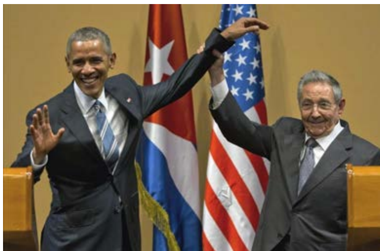
Barack Obama y Raúl Castro al cierre de una rueda de prensa conjunta en el Palacio de la Revolución. AP / Ramón Espinosa, 2016