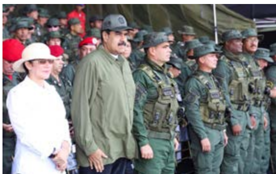
El presidente Nicolás Maduro junto a su esposa Cilia Flores, de blanco a la izquierda, y el ministro de Defensa, Vladimir Padrino López, en Maracay.