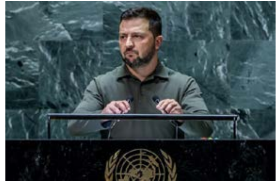
El presidente de Ucrania, Volodimir Zelenski, habla durante la Asamblea General de la ONU, en Nueva York. Foto: Justin Lane / EFE, 2023

nal. El caso del expresidente estadounidense Barack Obama es emblemático en este sentido. El mandatario contó con el fotógrafo Pete Souza para crear y difundir imágenes que mostrasen un hombre familiar, alegre, caballeroso, jovial, capaz de tener el control de los asuntos de Estado y la vida cotidiana. El fotógrafo registró diversas facetas de la vida de Obama, equilibrando las difíciles tareas que le tocó enfrentar con actividades habituales y comunes como las que ejecuta cualquier persona (abrazar a un ser querido, jugar, hacer muecas, correr junto a su mascota). Una forma de crear simpatía y proximidad con la imagen como mediadora y un inusual tratamiento de la figura presidencial. Desde las cuentas en redes sociales del expresidente e incluso desde las de la Casa Blanca estas fotos se difundieron, logrando más proximidad con los usuarios en una suerte de política virtual donde el carisma y la popularidad encuentran otras rutas. Décadas antes, John F. Kennedy había sido fotografiado en su cotidianidad, más allá de las tareas y obligaciones de su investidura como jefe de Estado, en una atmósfera similar. Obvia-