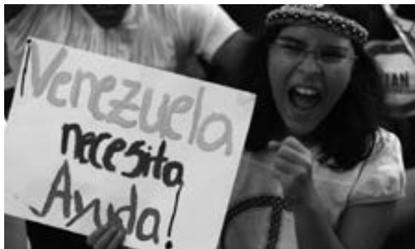
LA VOZ INTERNACIONAL

Los datos presentados a continuación sobre el derecho a la salud, son resultado de la aplicación de una metodología interdisciplinaria que reunió a múltiples actores informados para compartir, contrastar y fundamentar datos sobre la situación del derecho a la salud en Venezuela