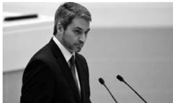
Mario Abdo, presidente de Paraguay.

Tensiones, desde las más evidentes hasta las imperceptibles, acompañarán estos primeros dos años de la presidencia de Iván Duque, quien está llamado a manejar su gobierno con precisión y frialdad, sin caer en chantaje ni de sus partidarios, ni de sus detractores. Las recientes actuaciones del Ejército de Liberación Nacional (ELN), formación guerrillera con la que no se han podido afianzar los cimientos de un hipotético diálogo tendiente a la pacificación, y el papel que pueda llegar a jugar Colombia ante la crisis multifactorial y cruenta que vive Venezuela, son retos que la coyuntura plantea, y la forma que tenga de enfrentarlos, permitirá hacer conjeturas respecto a la línea que se pueda esperar desde Bogotá.