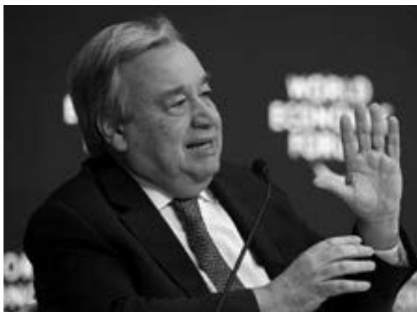
Antonio Guterres, secretario general de la ONU.