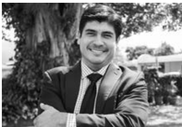
Carlos Alvarado, presidente de Costa Rica.

El año 2018 dejó una serie de claves para el análisis, datos y elementos que resultan útiles para explicar tendencias y para tratar, reconociendo el límite y el riesgo del ejercicio, de establecer posibles escenarios de cara al mediano plazo y el derrotero que pueda ir tomando cada país y por tanto la región