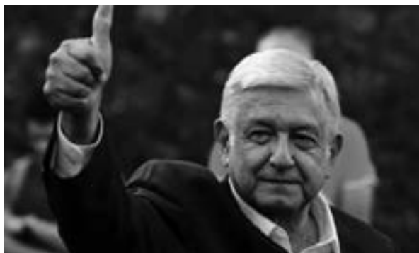
Manuel López Obrador, presidente de México.

Para cuando este ejemplar de la revista esté en la calle, puede haber cambiado el panorama. En todo caso, sirva como testimonio de lo que se plantea como parte de una realidad que, por dinámica, se hace indescifrable en términos de lapsos.