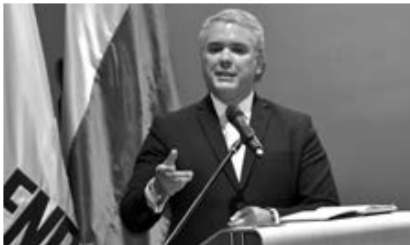
Iván Duque, presidente de Colombia.

El presidente electo ha manifestado tener conciencia de las tareas fundamentales de su gestión, así lo manifestó en su cuenta de la red social Twitter: "Mi deber será unir a esta República para sacarla adelante. Hemos visto un país con desigualdades que debemos corregir" 1 . No será un emprendimiento sencillo ya que el desgaste de los partidos políticos, sumado a una pérdida significativa en los niveles de calidad de vida y la brecha económica cada vez más notoria entre distintos sectores de la sociedad, se ha instalado con fuerza.