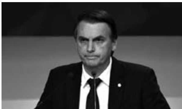
Jair Bolsonaro, presidente de Brasil.

Ya en temas realmente políticos, con sus respectivas implicaciones económicas y sociales, el recién juramentado presidente tiene la difícil tarea de saber llevar con hidalguía y sin demagogia, la tensa relación con el presidente de Estados Unidos, Donald Trump. Debe también hacer frente al andamiaje de prebendas que han beneficiado a los grandes grupos económicos en detrimento de la población general, y tiene ante sí el fenómeno, tan multimillonario como nocivo, que es el narcotráfico y la influencia que ejerce en la política. No puede ser lo mismo el acérrimo opositor y recurrente candidato, que el ahora flamante jefe de Estado.