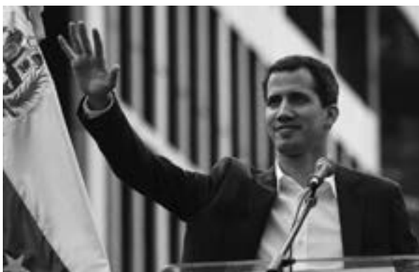
Juan Guaidó, presidente (E) de Venezuela.

Para el actual presidente es importante deslindarse de cualquier asociación con el fallecido dictador, y así lo ha manifestado. Ahora bien, nunca ha renegado de la vinculación de su padre con Stroessner, al tiempo que ha señalado lo que desde su punto de vista han sido logros del funesto régimen militar en áreas como la seguridad y la economía. A pesar de estos guiños al autoritarismo y de expresarse conservador en muchas de sus ideas, Abdo contó con el apoyo del segmento juvenil del electorado. En estas circunstancias no resulta fácil vislumbrar opciones que apunten a la transformación de anquilosadas prácticas políticas en un país que se sigue rezagando.