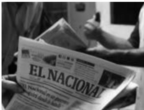
PERIÓDICO DIGITAL EL LIBERAL

El diario El Nacional , referencia del periodismo venezolano, con 75 años de circulación en el país, suspendió la publicación de su versión impresa el pasado mes de diciembre, debido a la falta de papel, insumo que solo lo suministra el Estado venezolano a través de la Corporación Alfredo Maneiro. El Nacional se ha convertido en el medio impreso número 66 que deja de circular de manera temporal o definitiva desde 2013. El Instituto Prensa y Sociedad de Venezuela (IPYS) ha reseñado que hace cinco años existían por lo menos noventa medios impresos en veinte estados del país. En la actualidad llegan a veintisiete. La caída ha sido del 68 %.