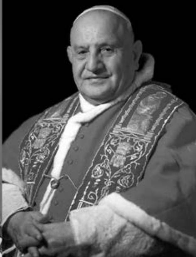
San Juan XXIII.